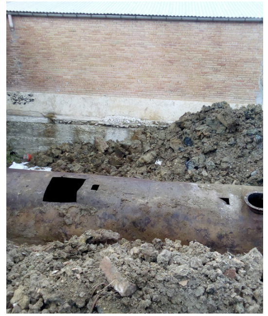
Posizionamento dei serbatoi a livello strada con gru