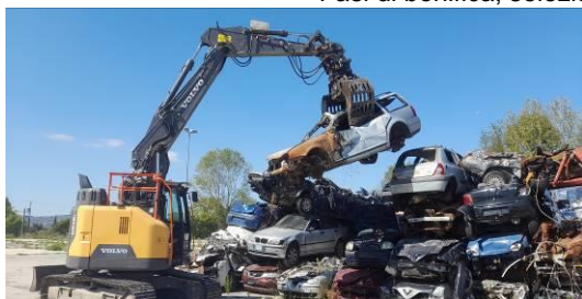
Fasi di carico rifiuti