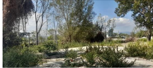
Area post intervento