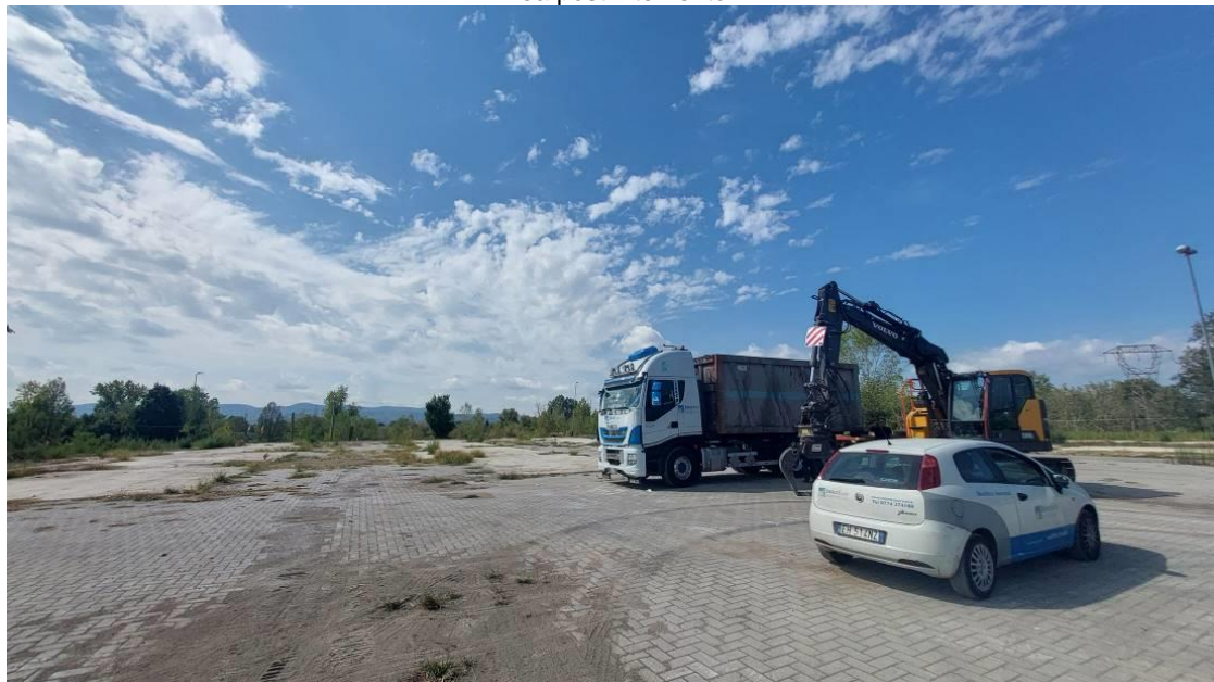
Area post intervento