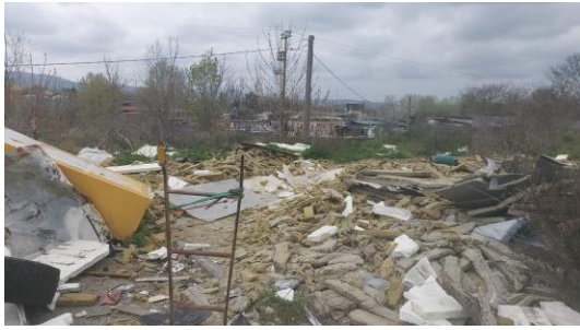
Area prima dell'intervento