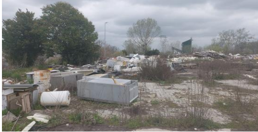
Area prima dell'intervento