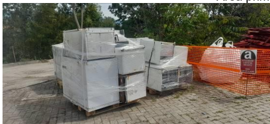
Fasi di bonifica, selezione e confezionamento rifiuti