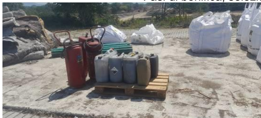
Fasi di bonifica, selezione e confezionamento rifiuti