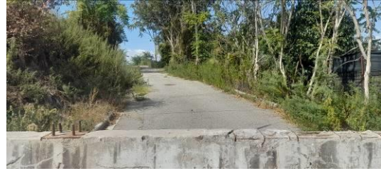
Area post intervento