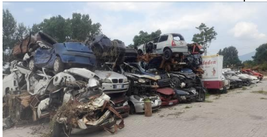
Area prima dell'intervento